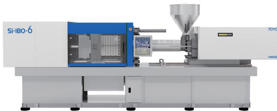
東洋機械金属(株)製 Si-180-6