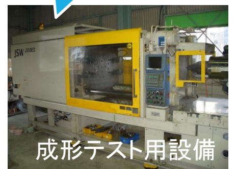
成形テスト用設備